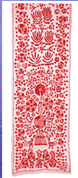
Рушник "на жердку" вишитий. Поч. XX ст.