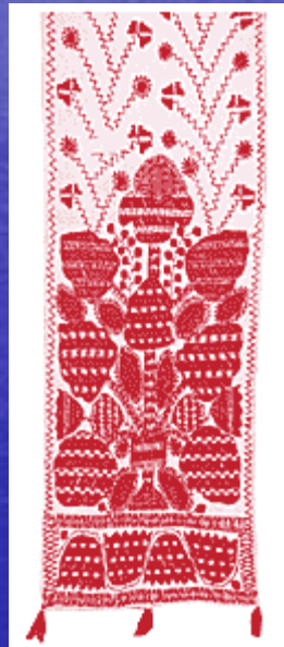
Рушник "шитий", 1905.