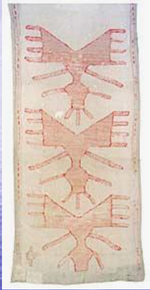
Рушник вишитий (фрагмент), XVIII ст.